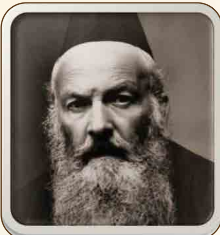
הגה"ק רבי אלחנן וסרמן זיע"א

הפורט התשיעי הוא מבצר גדול השוכן סמוך לעיר קובנה שבליטא. בתקופת השואה האומה הוא שמש את הנאצים הארוזים כאתר הוצאה להורג, וכמקום קבורה לגופות הנרצחים הקדושים. אחד הנספים היותר-מפסמים שנהרגו במקום, הוא הגאון הקדוש רבי אלחנן וסרמן זיע"א מגדולי ראשי הישיבות בעדן טרום השואה ומענקי הרוח של אותו הדור. בהקדמה לספרו 'קבץ שעורים', המעטר כל בית מדרש יהודי בתבל, מתארת הוצאתו להורג יחד עם משפחתו ותלמידיו הרבים.