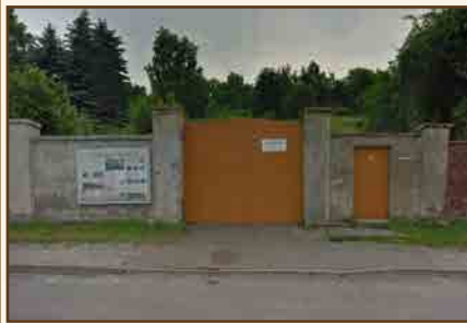
בית העלמין היהודי ברודומסק

תקופה קשה חלפה על תושבי העיר ראדומסק, עיר מגוריו של הרה"ק רבי שלמה הפהן רבינוביץ' זיע"א, מחבר הספר הידוע 'תפארת שלמה'.